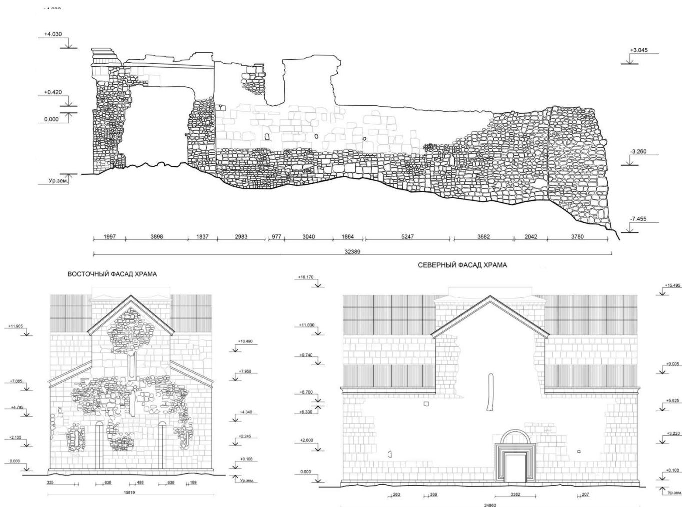
Рис. 2. - Обмерные чертежи фасадов Бедийского храма

В 100 метрах на запад от храма поперек плато расположились развалины епископского дворца. (рис.3). Епископский дворец археологически не изучен. В списке ОКН Республики Абхазия датировку строительства дворца относили к XI-XII вв., на век позднее Бедийского храма. Но дворец, как и церковь, имел скульптурный декор. Одна хорошо сохранившаяся резная панель украшена растительным орнаментом, ее можно датировать концом X в. Церковь и дворец были созданы, как комплекс в конце X в. Дворец мог перестраиваться неоднократно, т. к. жилые здания, перекрытые стропилами, горели чаще, чем церкви [9].