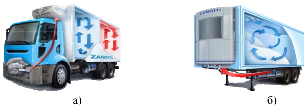
Рисунок 1 – Питание холодильной установки от а) двигателя автомобиля; б) автономного двигателя

В связи с этим, предлагается рассмотреть вопросы диагностики именно в секторе проблем, влияющих непосредственно на работу двигателя и связанных с ним систем автомобиля.