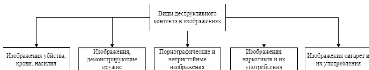
Рис. 1. – Виды деструктивного контента в изображениях

Деструктивный контент в изображениях может включать в себя различные материалы, которые представляют угрозу для людей и общества [4]. На рис. 1 приведены некоторые примеры деструктивного контента в изображениях.