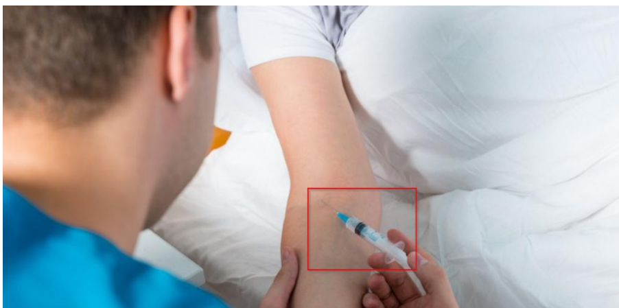
Рис. 4. – Укол врача

Рассмотрим следующий пример. На рис. 4 изображено, как врач делает укол пациенту.