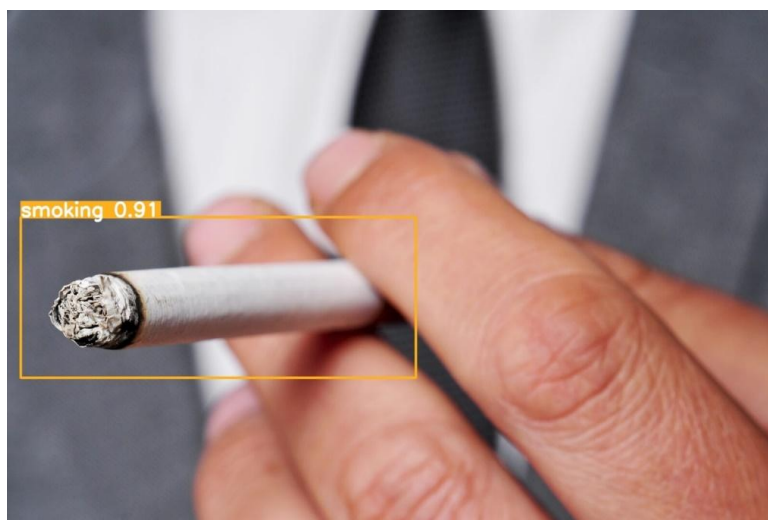
Рис. 5. – Пример поиска сигарет и курения в изображениях с помощью YoloV8

Также на рис. 5, рис. 6 показаны примеры поиска деструктивной информации в изображениях с помощью YoloV8.