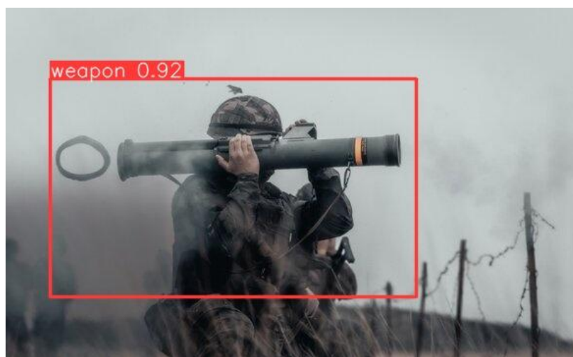
Рис. 6. – Пример поиска оружия в изображении с помощью YoloV8