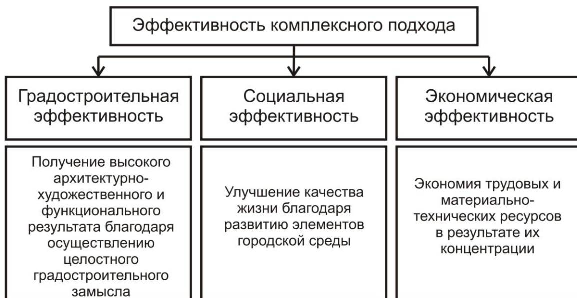
Рис. 1. – Эффективность комплексного подхода при планировании развития городских общественных пространств

При формировании городских общественных зон согласно основным составляющим комфортной городской среды (рис.2), следует придерживаться принципов, позволяющих привлечь интерес населения к данным территориям и влияющих на поведение человека в городской среде, т.к. предпочтительными являются наиболее безопасные улицы с комфортной окружающей обстановкой и наличием торговых и общественных учреждений по пути следования.