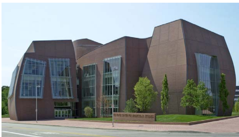
Рис. 2. Vontz Center for Molecular Studies, Cincinnati Medical Center University (Ohio, USA), by Frank Gehry

Другой тенденцией при проектировании учебных кампусов является применение принципа «адаптивного повторного использования», что предполагает использование старых, заброшенных исторических зданий, в том числе и университетских, и возвращение их в эксплуатацию [5]. Так, например Санкт-Раденгундский монастырь в Кембридже был преобразован в колледж Иисуса в 1490 году.