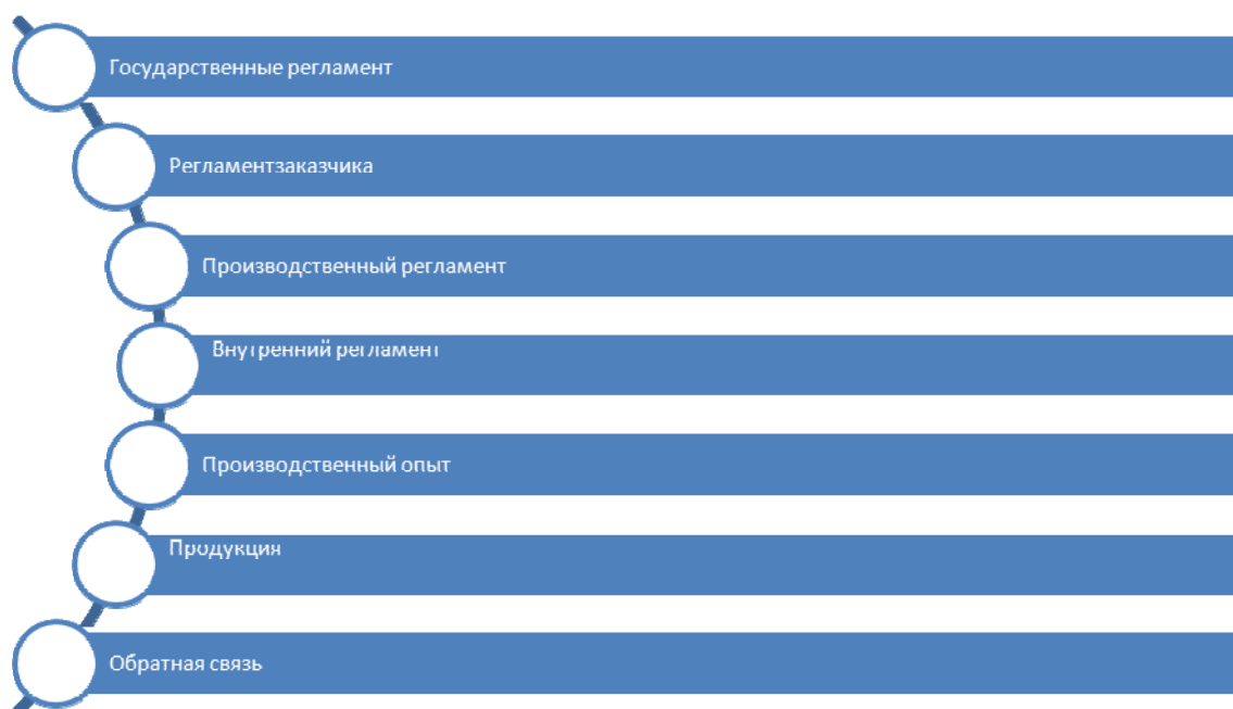
Рис.1 Иерархическая модель знаний в управлении компанией

Формируется единая база данных, предполагающая градацию документооборота и внедрение систем контроля и календаризации на основе авторского программного обеспечению «UNIX2016». Информация структурируется по ролевым и статусным маркерам по следующим схемам: