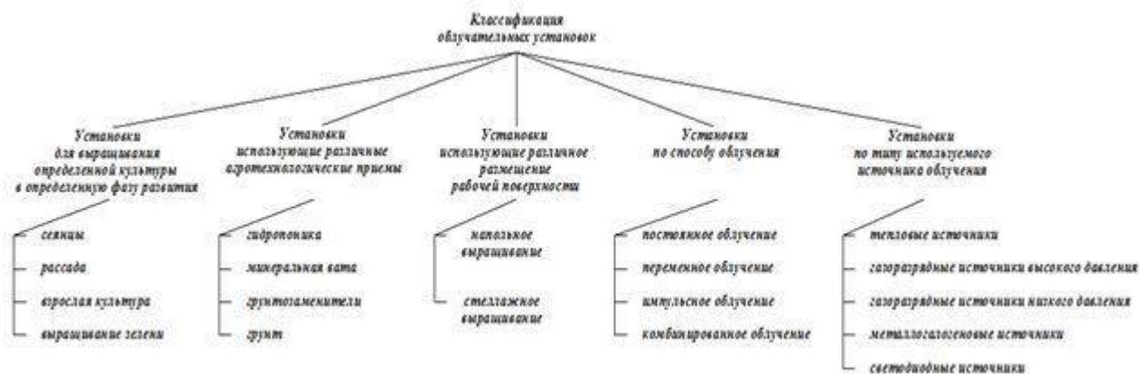
Рис. 1. – Классификация облучательных установок для выращивания рассады [4]

применения на практике. Такое положение дел связано с тем, что существующие установки по получению переменной интенсивности облучения либо технически сложны и трудно применимы в промышленных масштабах, либо реализованы только в лабораторных условиях, а простые и доступные, достаточно эффективные установки на сегодня не разработаны.