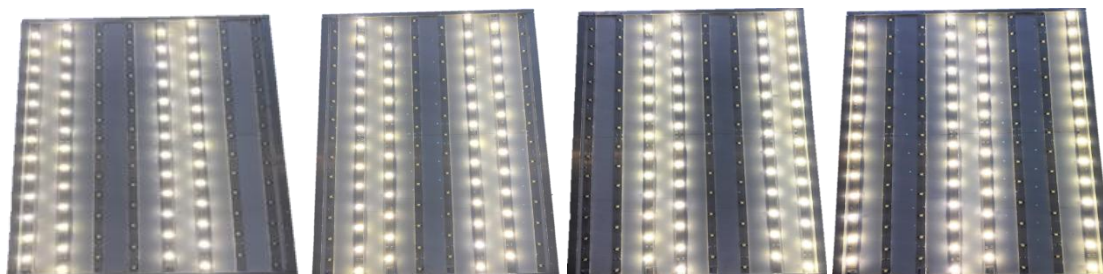
Рис. 4. – Работа установки в режиме переменного облучения

реализуется переменное облучение растений, а во-вторых снижается нагрузка на блок питания, т.е. для работы установки требуется источник с меньшей мощностью (рис. 4).