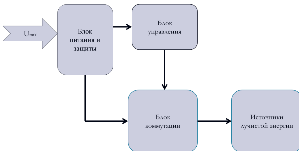
Рис. 3. – Блок-схема светодиодной облучательной установки

Блок-схема светодиодной установки представлена на рис. 3. На экспериментальной установке расположено восемь рядов светодиодов, каждый из которых имеет свое независимое питание, благодаря этому реализуется возможность попеременного включения и отключения каждого из них.