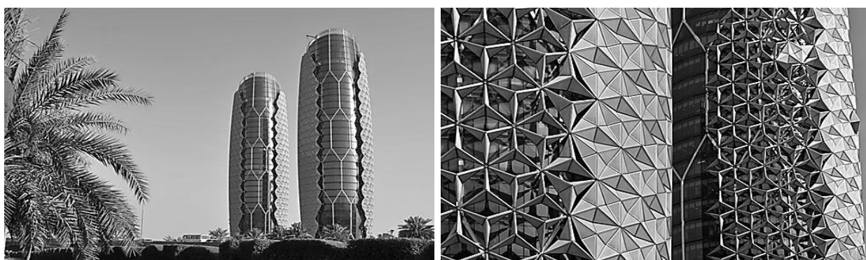
Рис. 5. [8] – Башни Аль-Бахар. Архитектурное бюро Aedas Architects. ОАЭ

Динамический фасад знаменитых башен Аль-Бахар, напоминающий покров из цветков, с лепестками, регулирующими умеренный климат помещений, затемняющими или открывающими поверхность здания для солнечного освещения [8], является ярким примером воплощенной трансформации фасадных конструкций. Сама динамическая система питается от солнечных панелей, установленных на крыше здания (рис.5).