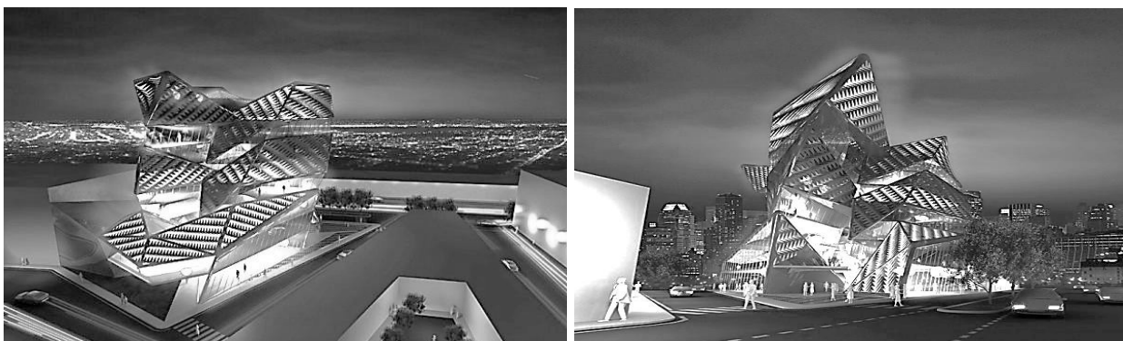
Рис. 1. [4] – Проект МФК Venetton Group Headquarters в трансформации.

комплекса Venetton Group Headquarters. Динамическая архитектура здания основывается на преобразовании трех одинаковых объемов в единое целое, посредством трансформации здания (рис. 1). Вращающиеся конструктивные элементы здания позволяют создавать, постоянно изменяющиеся фасадные решения, которые в свою очередь влияют на формирование застройки, и преобразовывают пространство окружающей городской среды [2,4]. Трансформация отдельных частей здания, осуществляется таким образом, что сами помещения остаются функционально неизменными: жилые апартаменты и офисные помещения – на верхних и на нижних этажах соответственно, коммерческие площади – на уровне земли.