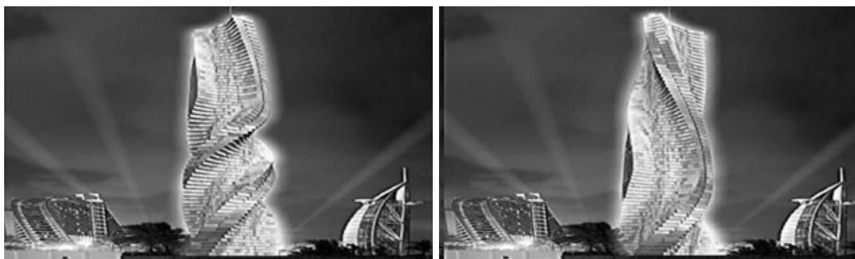
Рис. 2. [5] – Проект Da Vinci Tower в трансформации. Архитектор David Fisher. Дубай

Примером удачного архитектурного замысла в процессе выполнения задачи регуляции микроклимата помещений за счет обратимых движений конструктивных элементов, является реализованный проект кампуса университета в Кольдинге. Проект учебного учреждения с треугольной сеткой на фасаде сочетает внешнюю эстетику и внутреннюю эргономику. Трансформируемые под воздействием солнечного света треугольные цветные ячейки фасада и круги LED-освещения отвечают за климатическую обстановку и оптимальное освещение и подсвечивание здания. Внутреннее пространство здания за счет стеклянных перегородок и гибкого интерьера [6] также при необходимости трансформируется (рис. 3).