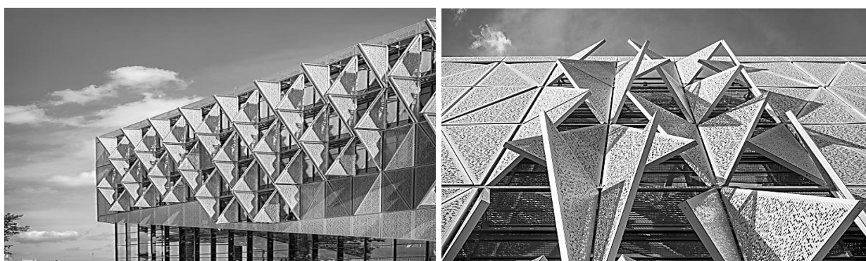
Рис. 3. [6] – Кампус университета Южной Дании в Кольдинге.

Примером удачного архитектурного замысла в процессе выполнения задачи регуляции микроклимата помещений за счет обратимых движений конструктивных элементов, является реализованный проект кампуса университета в Кольдинге. Проект учебного учреждения с треугольной сеткой на фасаде сочетает внешнюю эстетику и внутреннюю эргономику. Трансформируемые под воздействием солнечного света треугольные цветные ячейки фасада и круги LED-освещения отвечают за климатическую обстановку и оптимальное освещение и подсвечивание здания. Внутреннее пространство здания за счет стеклянных перегородок и гибкого интерьера [6] также при необходимости трансформируется (рис. 3).