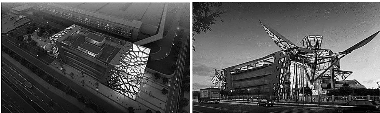
Рис. 8. [12] – Выставочный центр Zoomlion. Архитектурное бюро Amphibian Arc. КНР

оболочки здания заключающаяся в динамичном перевоплощении конструкций фасадов из прямоугольной формы в биоморфные фигуры различных животных и насекомых [12], призвана обеспечить естественную вентиляцию выставочного зала и проникновение в здание солнечного света (рис. 8).