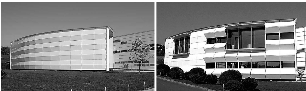
Рис. 4. [7] – Офисное здание Kiefer Technic Showroom. Архитектурное бюро Ernst Giselbrecht + Partner. Австрия

спроектирован из чередующихся железобетонных и стеклянных конструкций с алюминиевыми перфорированными внешними жалюзи, динамичных в течение полных суток. Трансформируемые пластины управляются специальными программами [7] и выполняют функции теплоизоляции, затемнения и санации (рис.4).