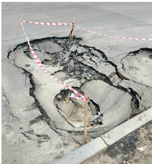
Рис. 1. – Провал на дороге по ул. Космонавтов г. Ростова-на-Дону

Ликвидация последствий провалов грунта требует существенных материальных затрат. В таком случае значительно эффективнее организовать работу по предупреждению и мониторингу карстовых и других опасных процессов в геологической среде города [6].