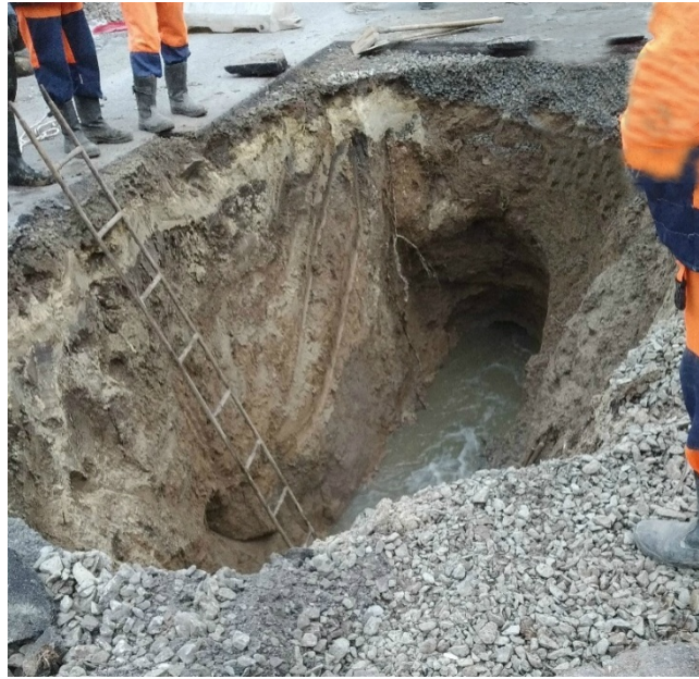
Рис. 2. – Провал по ул. 31-я Линия г. Ростова-на-Дону

Решением данного вопроса может оказаться создание службы по наблюдению за карстовыми процессами. Основой работы данной службы будет являться информационная система геологической ситуации на территории города. Такая система позволит классифицировать собранные данные и упростить их использование.