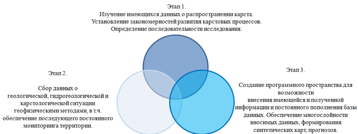
Рис. 3. – Основные этапы создания системы мониторинга

Создание информационной системы предусматривает наложение данных исследования на топографическую основу местности. Такая система будет способна не только отражать весь массив полученных данных, но и позволит оценивать территорию и прогнозировать развитие карстовых процессов на территории города.