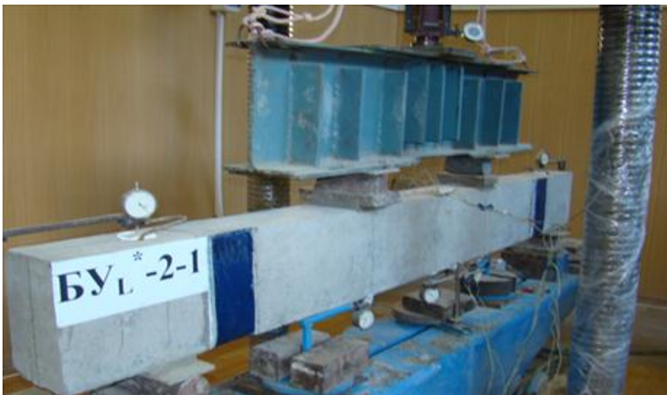
Рис.4. – Конструкции стенда для испытания опытных образцов

В процессе испытания (рис. 5) в середине пролета балок, замерялись средние деформации сжатой и растянутой зоны балок, а так же перемещения (прогибы) в характерных точках опытных образцов. Для этой цели использовались тензорезисторы сопротивления с базой 50мм и индикаторы часового типа с ценой деления 0,01мм.