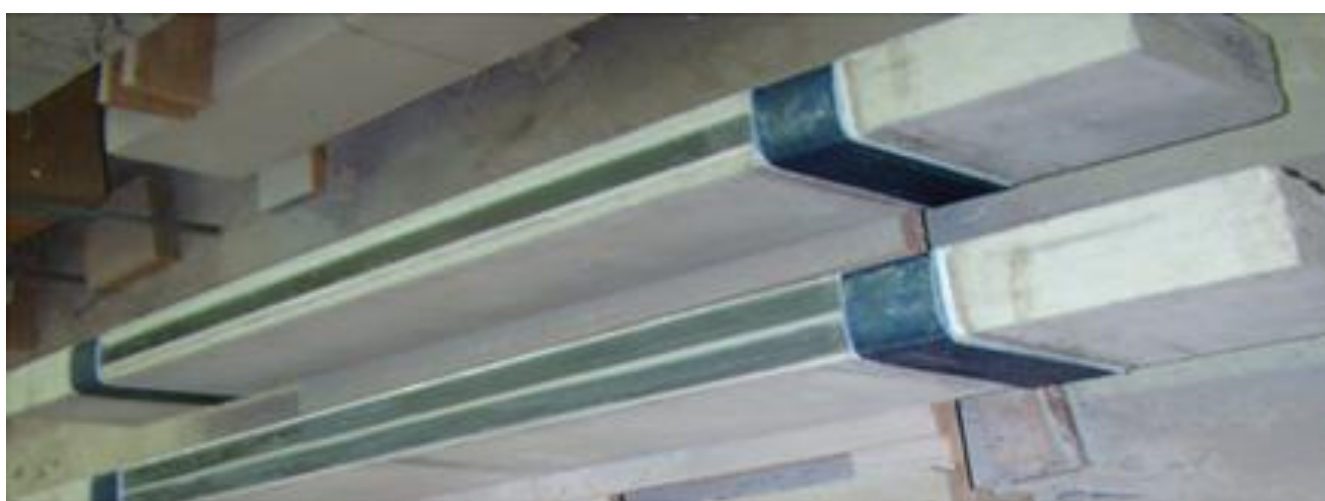
Рис.3. – Общий вид балок после наклеивания одной или двух полос из углепластика MBrace® LAMCF210/2800.50×1,4.100mc анкерами на их торце

Опытные образцы испытывались кратковременной нагрузкой на специально оборудованном стенде (рис. 4) по схеме однопролетных свободно опертых балок. Нагрузка N передавалась на балки через траверсу двумя сосредоточенными силами F , симметрично расположенными в третях пролета. Усилия F прикладывались через опорные пластины толщиной 20-25мм и шириной 100мм. Расчетный пролет балок - 180см, а пролет среза-60см (рис. 5).