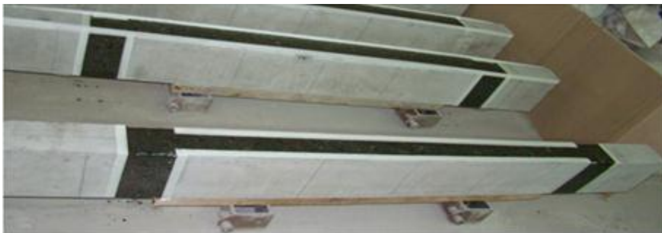
Рис.2. – Общий вид балок покрытых грунтовкой MBrace® Primer