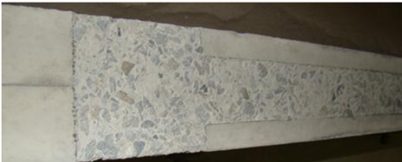
Рис.1. – Вид обработанной поверхности балки перед грунтовкой

Технические характеристики клеящих составов, грунтовок и шпаклевок для различных материалов, приведены в прилагаемых сертификатах. Там же даны общие сведения по технологии выполнения работ при усилении балок по системе MBRACE.